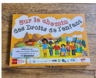
Un jeu prêté sur les droits de l'enfant réalisé par la MGEN